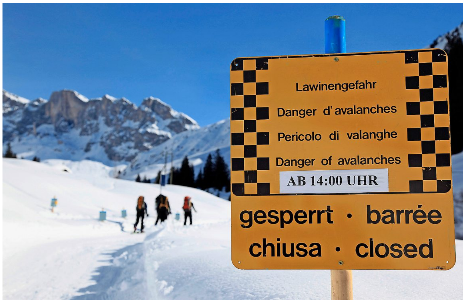
Kein Spielraum für Spekulationen: Lawinenwarntafel auf dem Weg zum Rotspitz im schweizerisch-österreichischen Grenzgebiet

Die Warndienste der Alpenländer schätzen die Risiken uneinheitlich ein – eine Initiative will das ändern